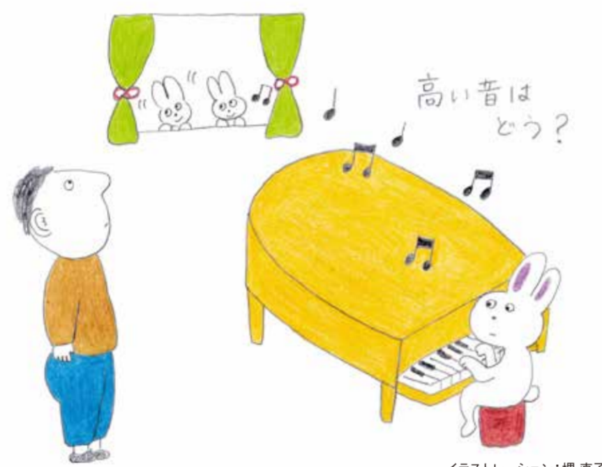
イラストレーション：堺直子

いずれにせよ、耳の聞こえが悪くなったり、異常を感じたりしたら医療機関を受診することが大切です。なお、気になることがあったらお気軽にご相談ください。